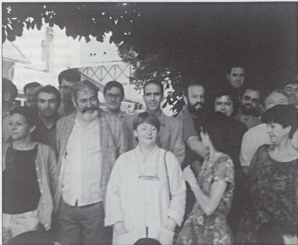
Militants du BNF de la FUC et de l'Exécutif fédéral de la FGE en session de recherche en juin 1994

Nous voulons prendre ce qu'il y a de plus positif dans les réalités de fonctionnement, d'action syndicale, de capacité à réfléchir et à construire des